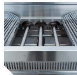
Detalle alojamiento quemadores