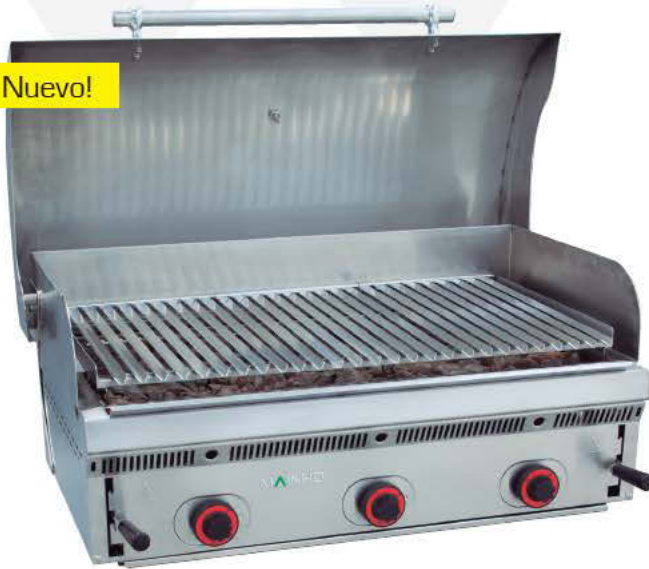
PBI-90 con tapa abierta