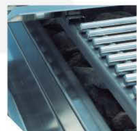
Recolector integrado en el marco frontal