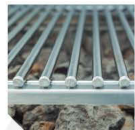
Rejillas de varilla