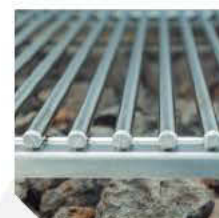
Rejillas de varilla