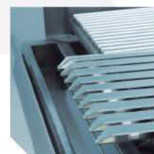
Recolector integrado en el marco frontal