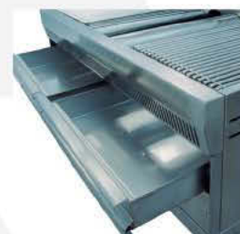
Detalle bandejas contenedoras de agua