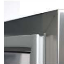
CIERRE MAGNÉTICO FERMETURE MAGNÉTIQUE