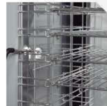
SONDA AL CORAZÓN SONDE AU CŒUR

Construidos en acero inoxidable Acabado pulido en la cámara, Scotch-Brite en el exterior Cámara con ángulos redondeados para facilitar la limpieza Aislamiento de 60mm, en poliuretano expandido libre de CFC y HCFC Control digital Sonda al corazón incluida Puerta reversible (solicitar en el momento del pedido) Micro interruptor paro ventilador Estructura porta bandejas desmontable para facilitar la limpieza Lámpara germicida (opcional) Condensación por aire Sistema "defrost" automático Conservación automática de fin de ciclo Preinstalación para USB y HACCP (para los modelos "BF")