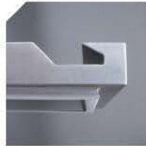
ASA ABATIDORES BF ANSE ABATTEURS BF