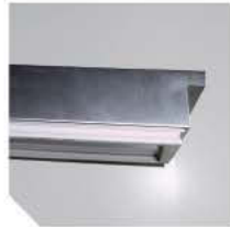
ASA ABATIDORES BE ANSE ABATTEURS BE