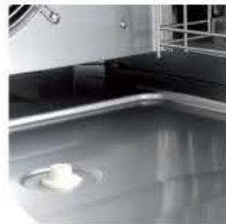
DESAGÜE INTERNO ÉCOULEMENT INTERNE